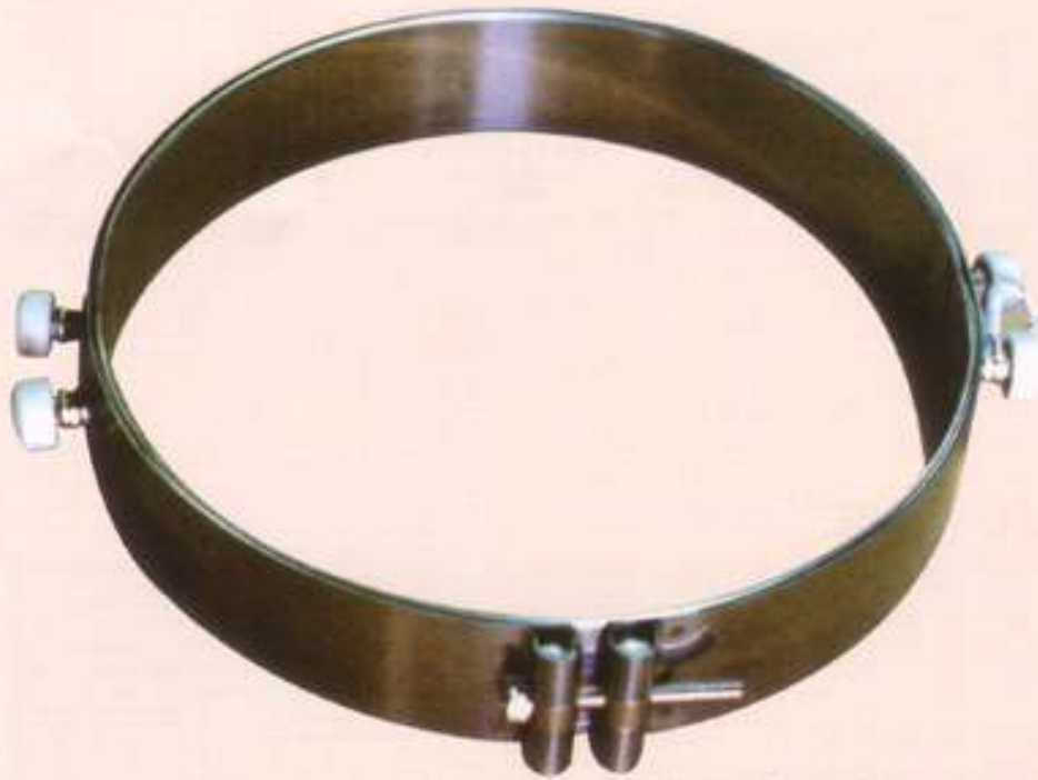
標準型2ピースバンドヒーター

標準として1ピース型と2ピース型がありますが、更に径の大きい場合は3ピース以上のものも製作致して居ります。